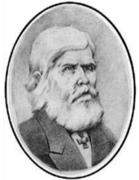
Иосиф Антонович Гашкевич (1814–1872), двоюродный брат св. пр. Иоанна Кормянского, - лингвист, востоковед; первый дипломатический представитель Российской империи в Японии (1858–1865)

Второй двоюродный брат отца Иоанна, например, был настоятелем храма в городе Киеве, ЦарьКонстантиновского храма.