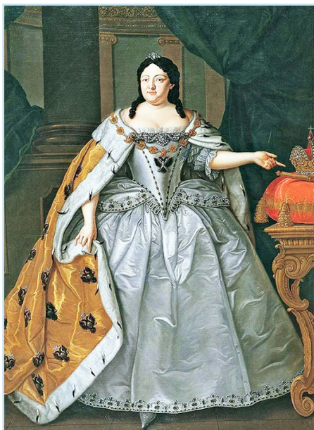
Императрица Анна Иоанновна

Вышедшие манифесты императрицы Анны Иоанновны в 1733–1734 гг. с приглашениями ветковцам вернуться в Россию