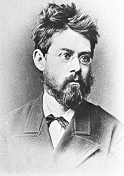
Народоволец Лев Тихомиров

В 1907 году прежний опыт членства в революционных организациях сослужил хорошую службу Льву Александровичу. Сам глава Кабинета министров Пётр Аркадьевич Столыпин приглашает его в Санкт-Петербург в качестве главного консультанта по вопросам рабочего законодательства. Проще говоря, Тихомиров, как бывший революционер, мог подсказать, каким образом нужно улучшить положение рабочего класса, чтобы не допустить революции.