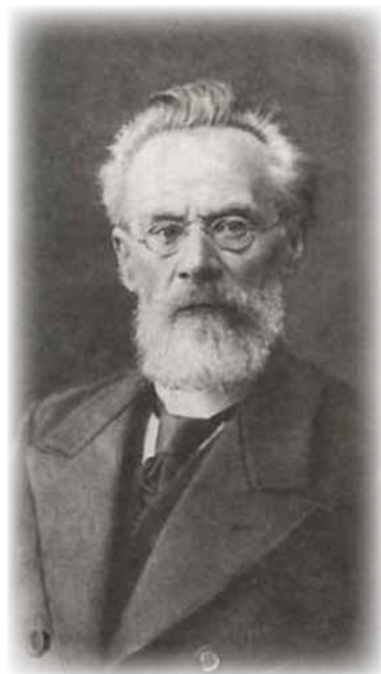
Л.А. Тихомиров в зрелые годы

Умер Лев Александрович 16 октября 1923 года в Сергиевом Посаде, оставив после себя замечательное литературное наследие, которое полезно читать всякому патриоту, православно-му человеку, и не только.