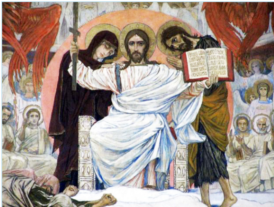
В. Васнецов. Страшный суд (фрагмент)

Поэтому будем просить у Господа, чтоб Он дал нам сил, чтоб Он дал нам свою печать Божественную в сердце, чтобы мы не оставались равнодушными, как вода, как камень, чтобы мы были живыми людьми, отзываемыми на страдания и на нужду тех, кто нас окружает. И еще одно. В притче люди делятся на черных и белых, а чаще всего бывает так, что в нас живет и черный, и белый, и равнодушный, и отзывчивый, поэтому иногда разделение и борьба происходят в одном сердце человеческом. Так пусть же победит в нас вот это белое, светлое, доброе, любовное начало, чтобы мы услышали глас нашего Господа: “Придите, благословенные Отца Моего, наследуйте Царство, уготованное вам от создания мира”. Аминь.