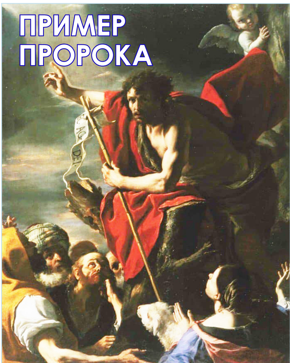
Маттия Претти. "Проповедь Иоанна Крестителя". Ок. 1665 г.