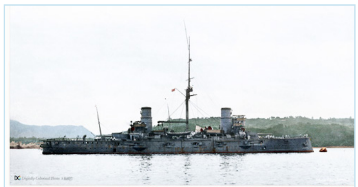
... и «Касуга»