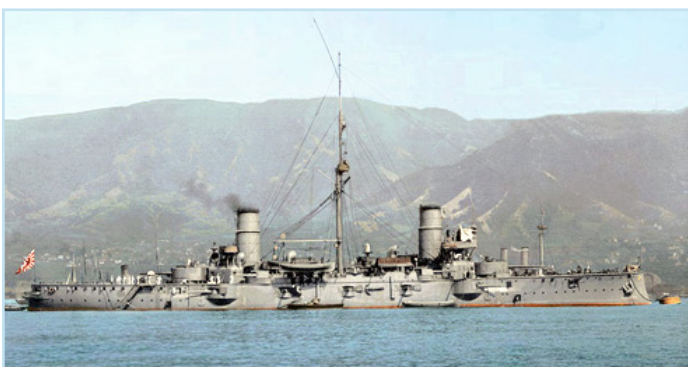
Броненосный крейсер «Ниссин»...