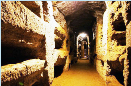
Римские христианские катакомбы