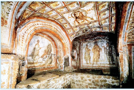
Римские христианские катакомбы

(Начало на стр. 4. "Не бойтесь смерти!")