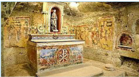
Христианские катакомбы Мальты