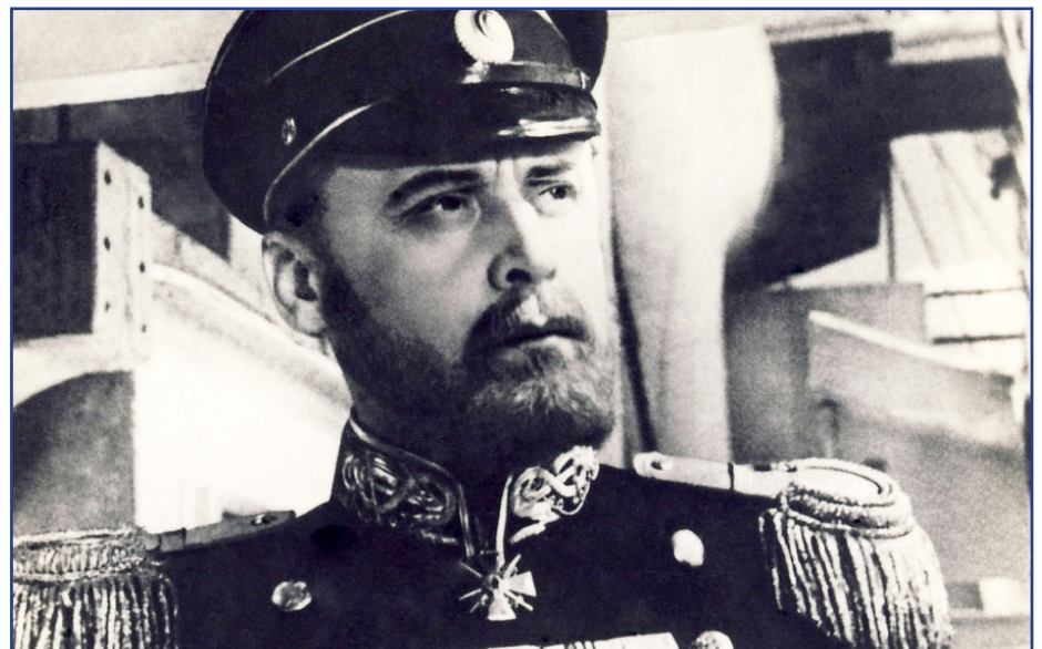
Борис Николаевич Ливанов (1904-1972) в роли командира крейсера «Варяг» В.Ф.Руднева