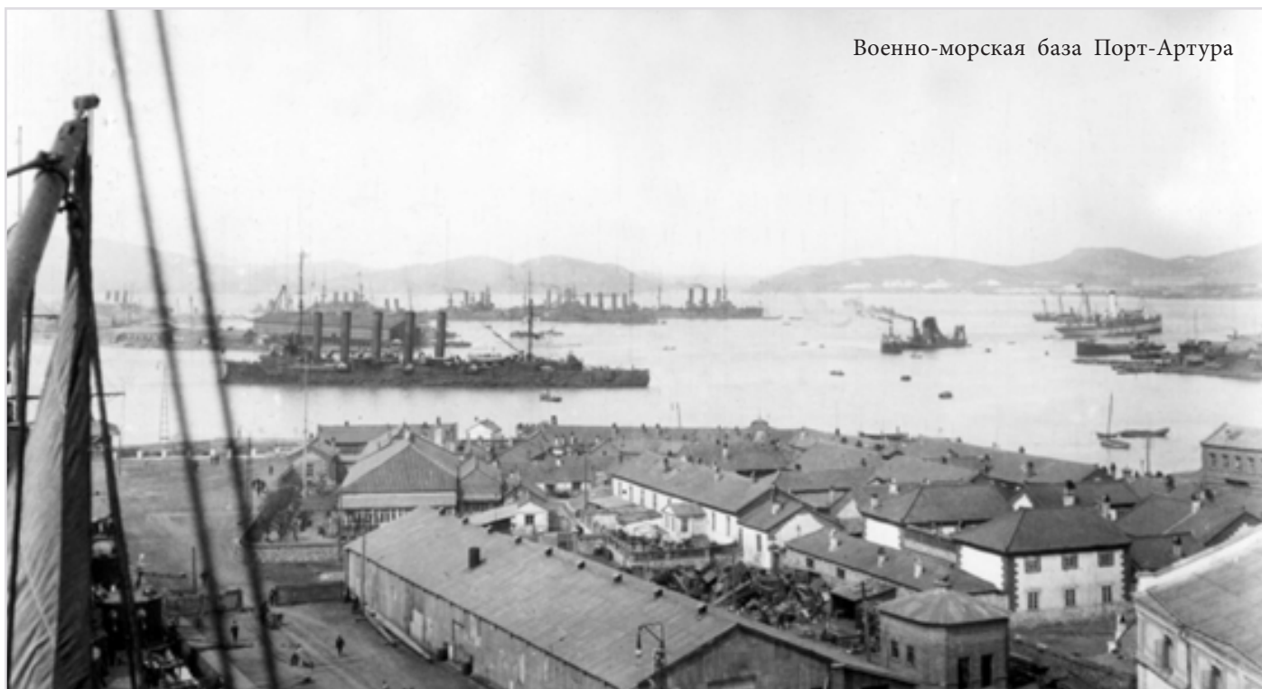
Военно-морская база Порт-Артура

С ростом воинского контингента, приездом строительных специалистов, усилением морской Эскадры Тихого океана, увеличивалось число русских в Артуре и только построенном Дальнем. Несмотря на то, что в 1903 году всё ещё большую часть населения Порто-Артура – двадцать три тысячи человек из сорока двух – составляли