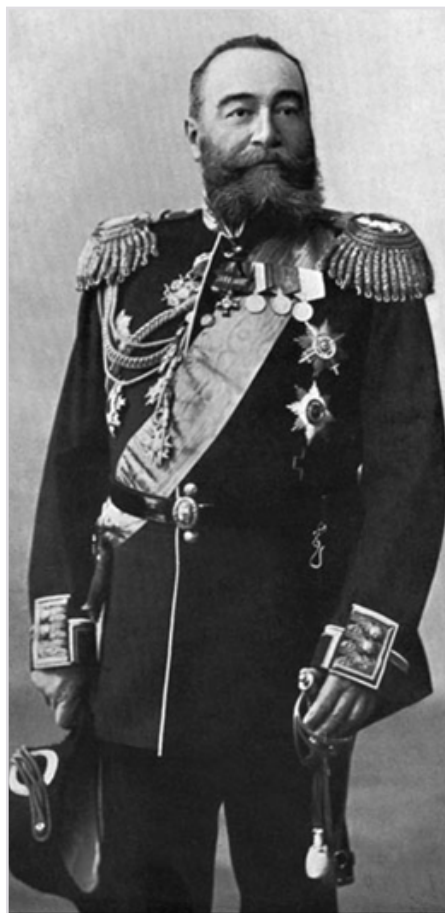
Вице-адмирал Российского Императорского флота Евгений Иванович Алексеев

военные флотилии Японии, России, Франции САСШ, Великобритании и даже Австро-Венгрии. Их целью была приморская крепость Дагу. 17 июня состоя-