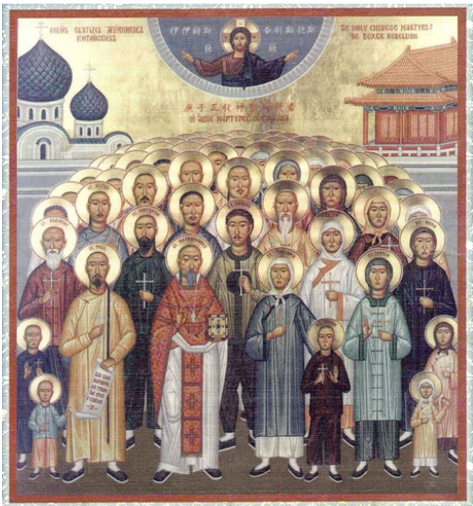
Китайские новомученики, жертвы «Варфоломеевской ночи в Пекине»