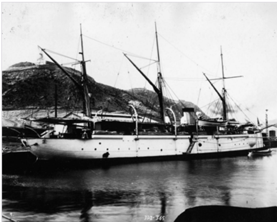
Участница сражения при Дагу канонерская лодка «Кореец»