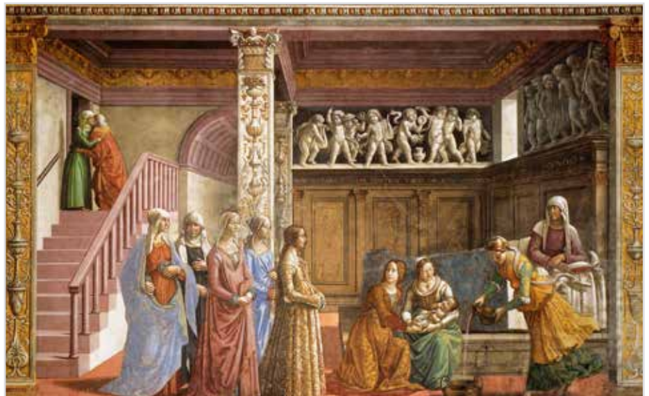
Доменико Гирландайо «Рождество Марии». Фреска. 1485-1490 гг.