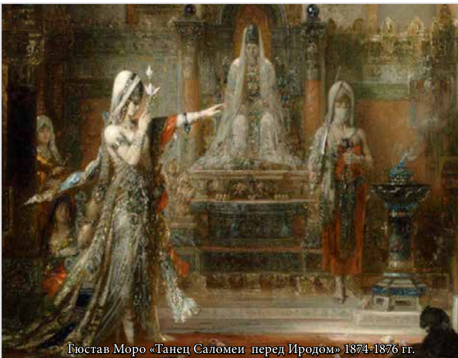
Гюстав Моро «Танец Саломеи перед Иродом» 1874-1876 гг.