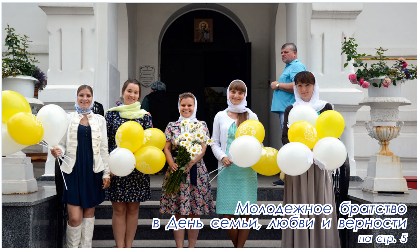
Молодежное братство в День семьи, любви и верности на стр. 5

Монастырский еженедельник издается по благословению епископа Гомельского и Жлобинского Стефана