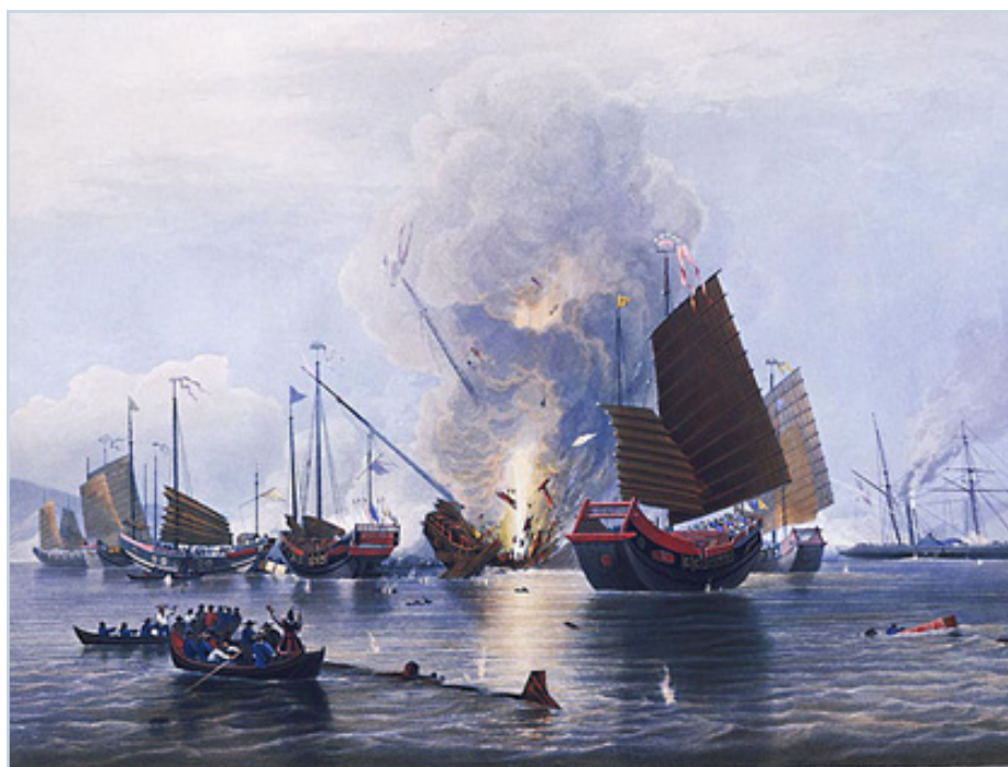
Первая опиумная война. Китайские джонки под огнём английских фрегатов