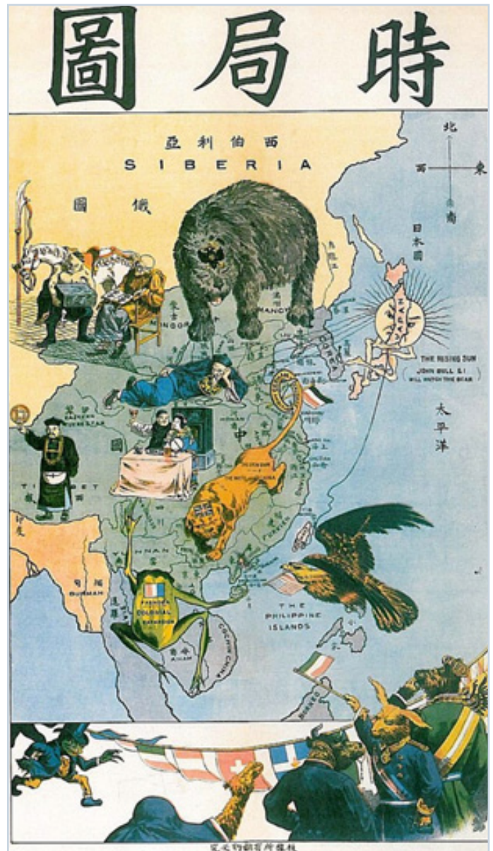
Китай в 1900 году. Медведь олицетворяет Россию, солнце – Японию, лев – Британию, орёл – Соединённые штаты, лягушка – Францию. Снизу – остальной мир наблюдает за развитием ситуации.