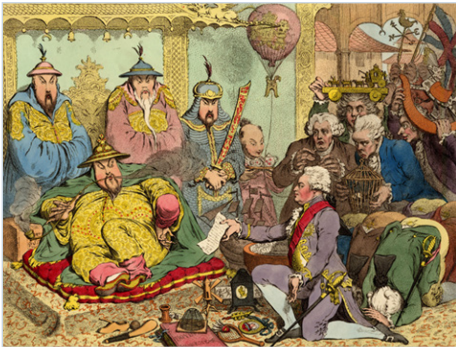
Встреча британских послов при дворе императора. 1792 г.

В том же XVIII веке Китайская империя была самым могущественным государством в Восточной Азии. Кроме нынешнего известного нам Китая, территория Поднебесной контролировала сегодняшние Корею, Монголию, Вьетнам, Лаос, Камбоджу, Таиланд. По военной и экономической мощи никто не мог в регионе тягаться с китайцами. Однако, самое интересное в этой ситуации то, что сам Китай китайцам не принадлежал. Императорская династия Цин, правившая с XVII века вплоть до 1912 года, происходила из Маньчжурии, области к северу от этнического Китая, из народа чжурчжэней, родственного современным эвенкам. Придя к власти, маньчжуры заняли все высшие государственные должности, но сохранили традиционный китайский уклад жизни, культуру, язык и систему управления государством. Так обычно бывает, когда народ более сильный в военном отношении покоряет народ более сильный в отношении культурном. Единственное культурное требование, предъявленное маньчжурами к китайцам, состояло в обычае брить лбы, а оставшиеся волосы заплетать в косичку. Закон об этом был принят ещё в 1645 году и действовал до самого