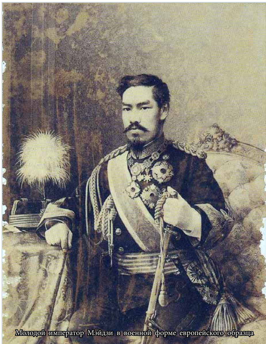
Молодой император Мэйдзи в военной форме европейского образца

Фудзивара, Асикага и Токугава. Особенность сёгуната была в том, что страна была раздробленной на небольшие княжества. Во главе каждого из них стоял собственный правитель – даймё. Эти удельные князьки, имевшие собственные армии самураев, не были обязаны платить налогов в казну, но по обычаю регу-