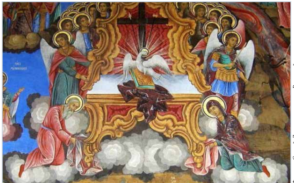
Фреска «Святой Дух на престоле». Рильский монастырь.