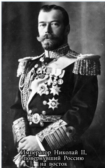
Император Николай II, повернувший Россию на восток