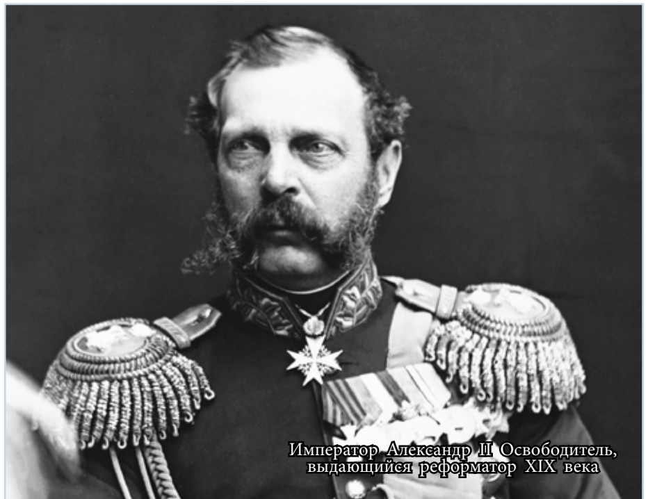
Император Александр II Освободитель, выдающийся реформатор XIX века

в нашей истории была перевернута. Во-вторых, Царь провёл множество реформ в образовании, армии, местном самоуправлении, судебной системе, печати и других сферах. Им была отменена рекрутская повинность, заменённая на всеобщую воинскую, которая с некоторыми изменениями продолжает существовать по сей день. Судебная система вышла из-под государственного контроля, появился суд присяжных, были введены должности присяжных поверенных (адвокатов). По отзывам современников, Император Александр II создал самую гуманную судебную систему во всей Европе. В уездах были созданы земства, в городах – городские думы, которые решали множество вопросов местной хозяйственной жизни. Так, например, трамвай в Витебске,