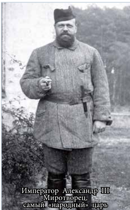
Император Александр III Миротворец, самый «народный» царь