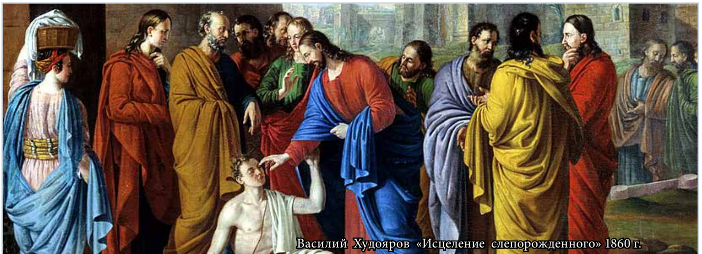
Василий Худояров «Исцеление слепорожденного» 1860 г.