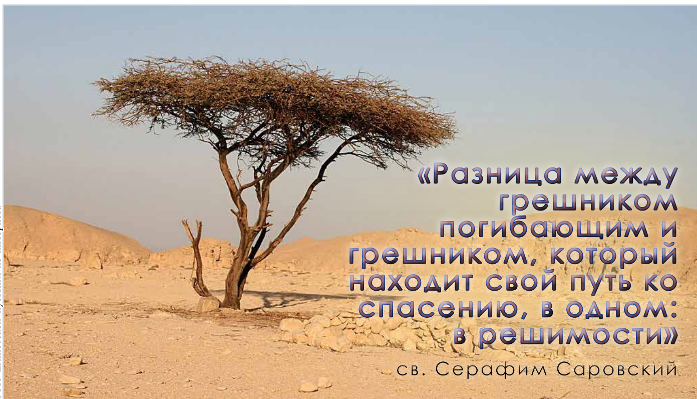
Фото Египетской пустыни

«Разница между грешником погибающим и грешником, который находит свой путь ко спасению, в одном: в решимости»