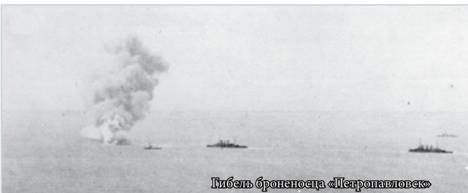
Гибель броненосца «Петропавловск»