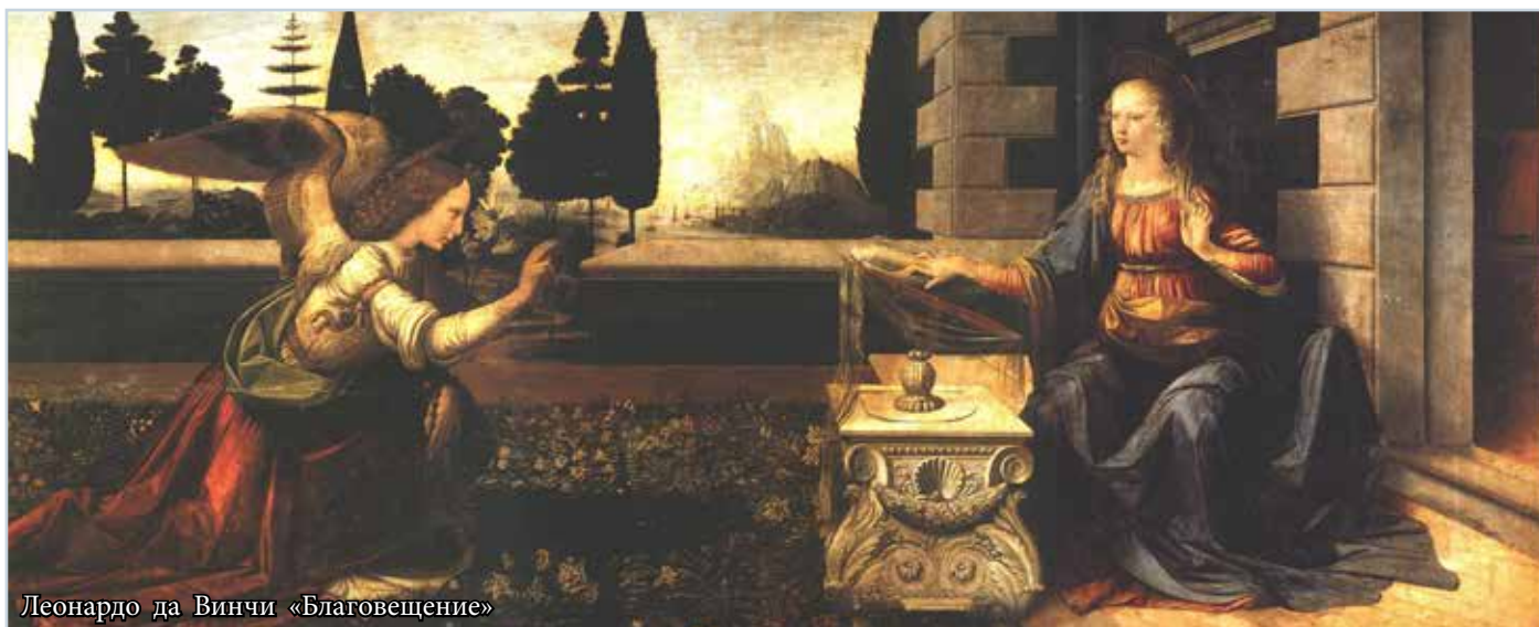
Леонардо да Винчи «Благовещение»

Радость о том, что, глядя на него, так легко верить в небесную голубизну мира, в небесное призвание человека. Радость о Благовещении — о благой вести, принесенной ангелом, что люди обрели благодать у Бога, и что скоро, скоро — через нее, через эту никому неизвестную галилейскую деву, начнет совершаться тайна спасения мира: к ней придет Бог, и придет не в грехоте, не в страхе, а в радости и полноте детства, и через нее воцарится в мире Ребенок, слабый и беззащитный, но который навсегда, навеки сделает бессильными все силы зла. (Окончание на стр. 5)