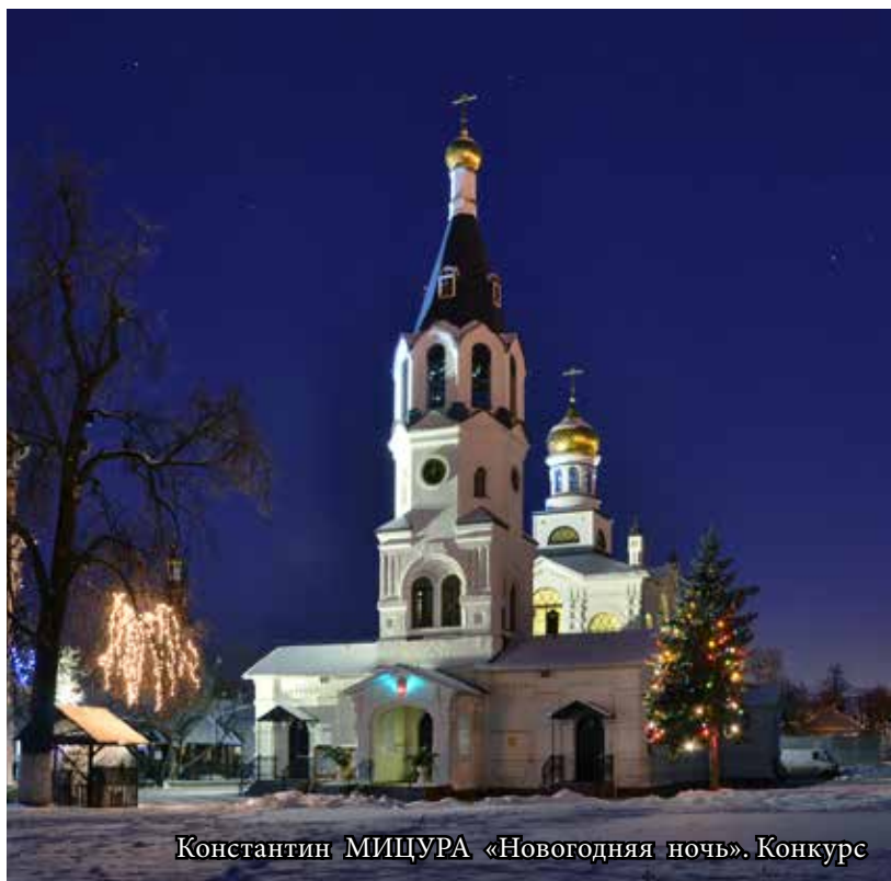
Константин МИЦУРА «Новогодняя ночь». Конкурс