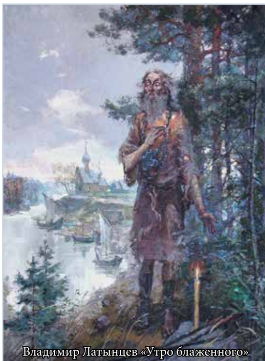
Владимир Латынцев «Утро блаженного»

Блаженный Прокопий Устюжский прожил в юродстве 60 лет. На Московском соборе в 1547 году был причислен к лику святых и прославлен в чине юродивого.