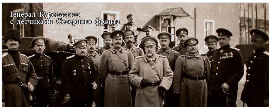
Генерал Куропаткин с летчиками Северного фронта