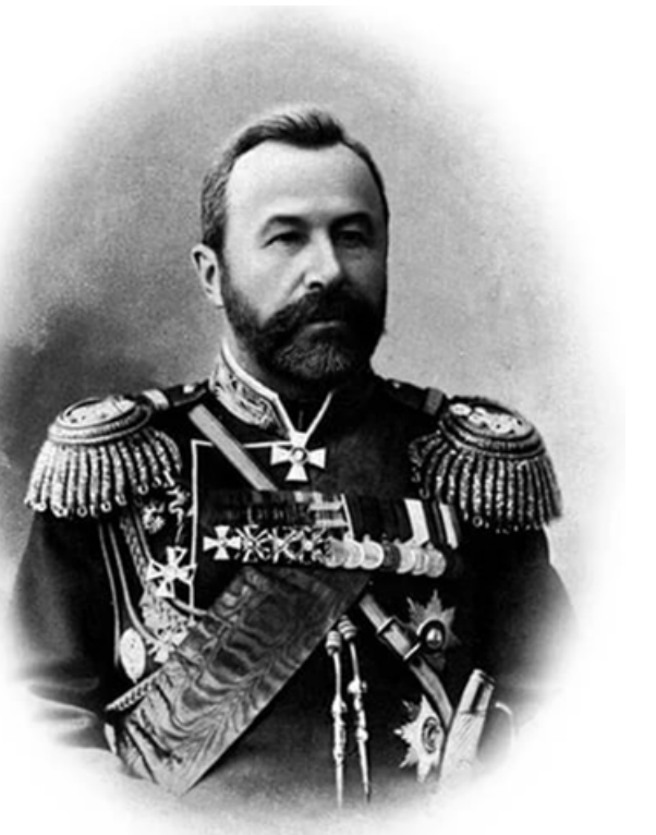
Генерал-адъютант Алексей Николаевич Куропаткин (1848 - 1925)

1877 год для России стал началом последней большой войны XIX века. Идея освобождения балканских славян от османского ига привела к крупномасштабному конфликту с турками. Подполковник Куропаткин был направлен в штаб доблестного генерала Михаила Дмитриевича Скобелева, прозванного Суворовым XIX века. Здесь, при штабе, он провёл всю войну. Особенно интересна в этот период характеристика, данная ему, как командиру, самим Скобелевым: «Помни, что ты хорош на вторые