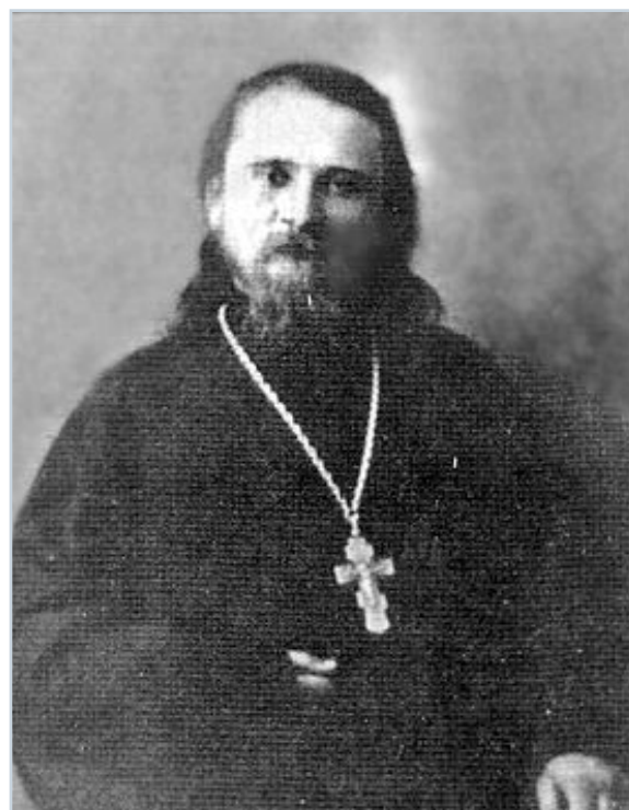
Священномученик Иоанн (Пашин)