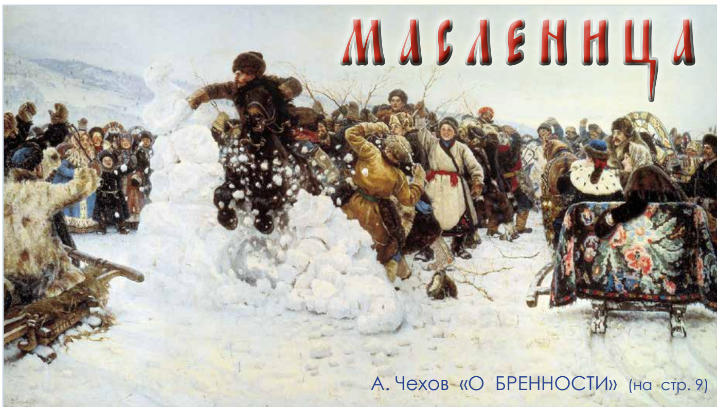
А. Чехов «О БРЕННОСТИ» (на стр. 9)

Монастырский еженедельник издается по благословению епископа Гомельского и Жлобинского Стефана