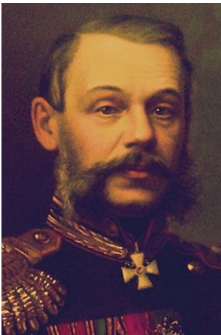
Военный министр Российской Империи граф Дмитрий Алексеевич Милютин (1816-1912), автор военной реформы 1860 - 1870-х гг.