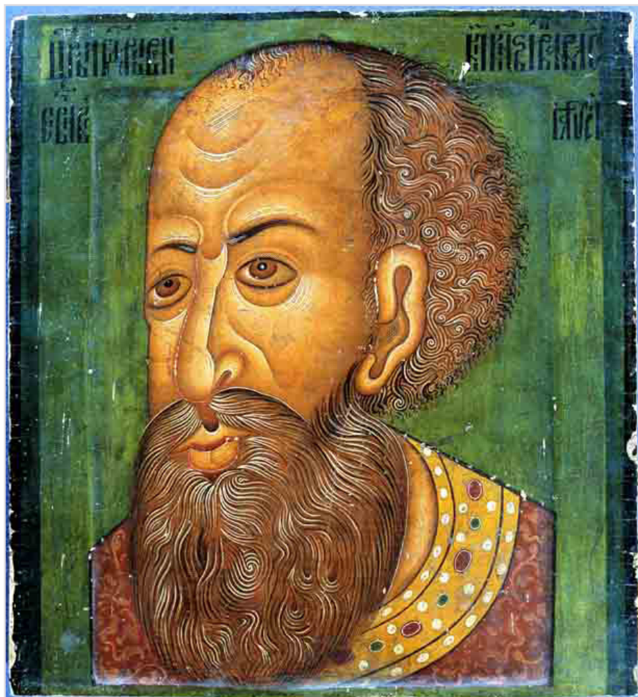
Иван Грозный. Парсуна. Начало 17 века (?)

Принципиальная разница двух вышеуказанных позиций обусловлена не только и не столько разницей в подборе исторических фактов, характеризующих Ивана IV. Да, действительно, почитатели Грозного царя проявляют гиперкритичное отношение к тому, что написали о нем иностранцы, а также отечественные «малоцерковные историки», напоподобие Н. Карамзина или С. Соловьева. И да, критики «иоаннитов» – в отличие от них самих – более активно ссылаются на