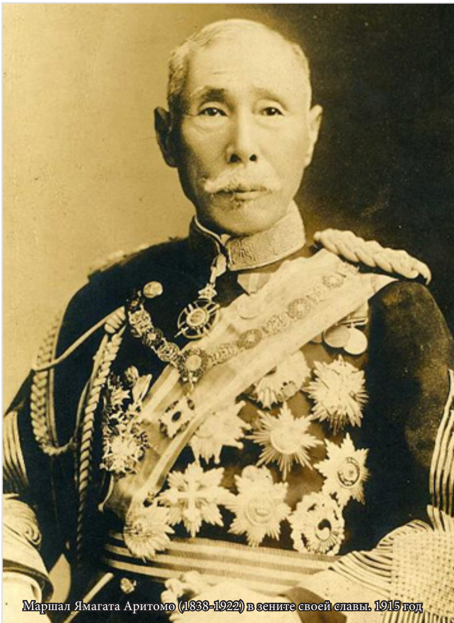
Маршал Ямагата Аритомо (1833-1922) в зените своей славы. 1915 год

В начале 1880-х гг. в правительстве страны усилилось противостояние либералов и консерваторов. Первых возглавлял министр финансов Окума Сигэнобу, консерваторов же пред-