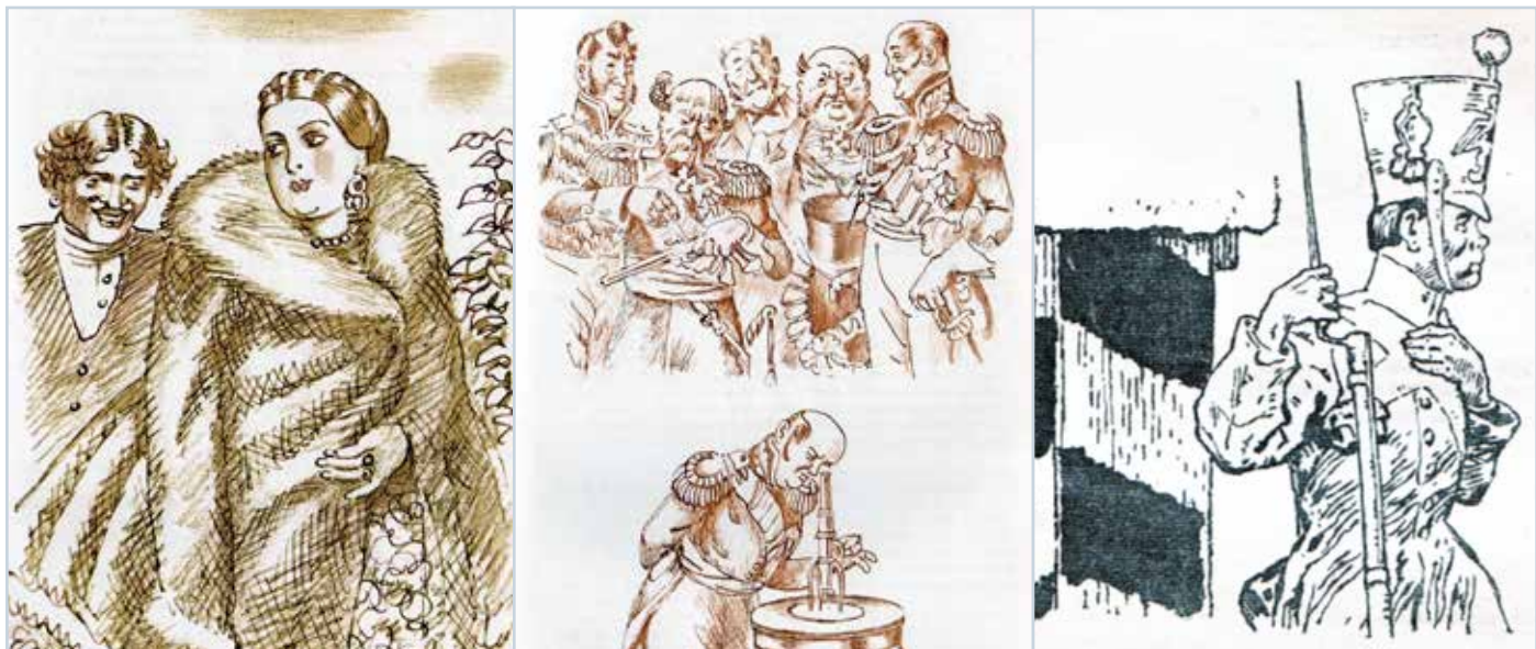
Иллюстрации к рассказам Н. С. Лескова «Леди Макбет Мценского уезда», «Левша», «На часах»

В 1880-е годы Лесков отдал дань жанрам притчи, легенды и сказки. Эти жанры дидактичны, они, по мнению беллетриста должны донести до сознания самых широких масс, что главный смысл бытия человека на земле – это любовь и сотворение добра. Лесков верил, что несмотря на все жизненные перипетии, невзгоды, люди будут жить так, что «сумма добра» всегда будет перевешивать зло.