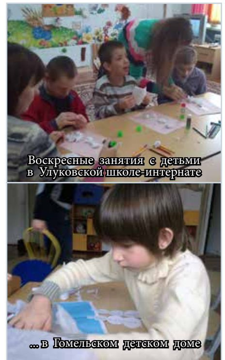
Воскресные занятия с детьми в Улуковской школе-интернате