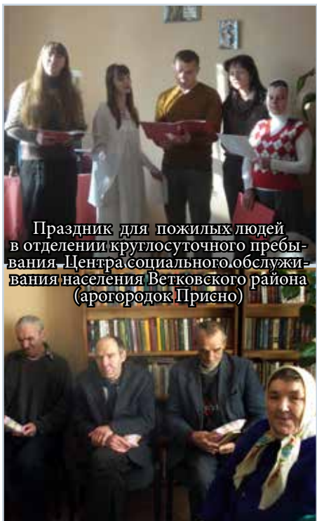
Праздник для пожилых людей в отделении круглосуточного пребывания Центра социального обслуживания населения Ветковского района (аэрогородок Присно)