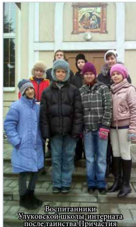
Воспитанники Улуковской школы-интерната после таинства Причастия