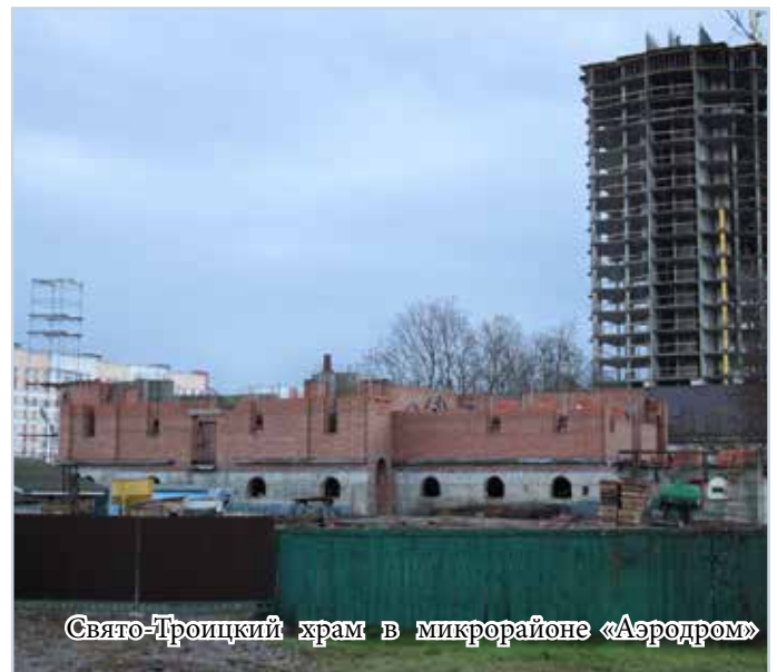
Свято-Троицкий храм в микрорайоне «Аэродром»

на численность населения областного и районных центров, и сельских населенных пунктов. Первая группа составляет более чем \frac{2}{3} от общего населения области. Здесь снова возвращаемся к вопросам, которые должны звучать рефреном в подобном рассуждении: для кого и кем строится приходской храм? То есть, если есть некая группа людей, желающих возвести храм, то должны ли они возводить его сами? Или кто-то (но кто?) должен сделать эту работу за них и для них. Каково современное белорусское село? Если кто-то не знает, потрудитесь проверить. Предварительно поделюсь своими наблюдениями – оно бедное. Возразят, что и город не богат. Но кроме этого деревни малолюдны, иногда почти пусты. Старушки хотели бы, чтобы была церковь, но трезво оценивают ситуацию.