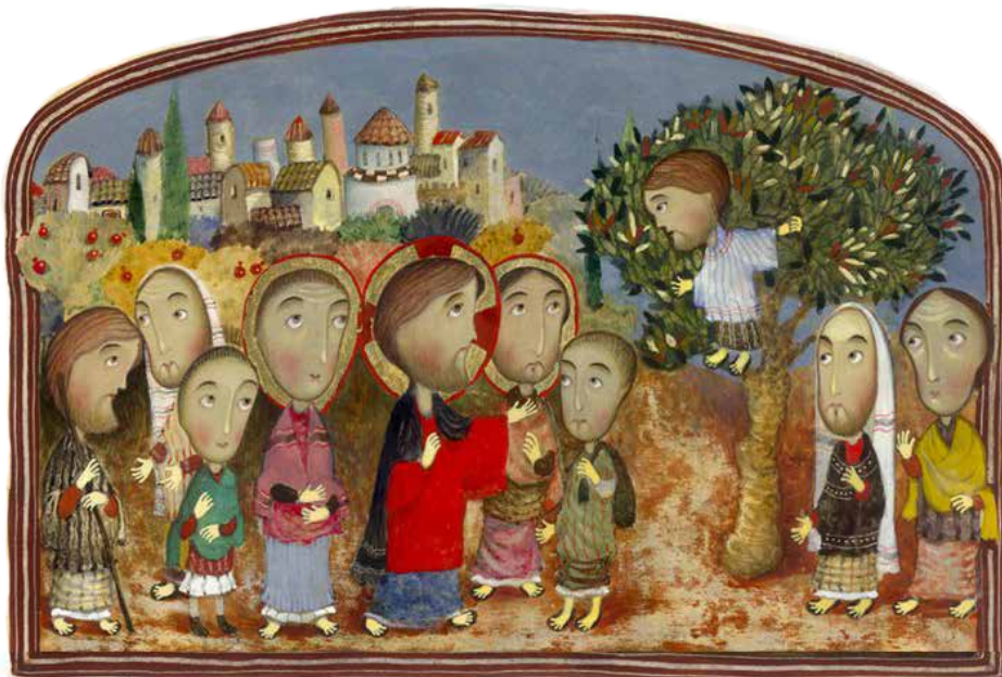
Давид Попиашвили «Обращение Закхея»

Из книги митрополита АНТОНИЯ Сурожского «Воскресные Евангельские чтения по Пятидесятнице. Часть III. (Проповеди)» 20 января 1991 г.