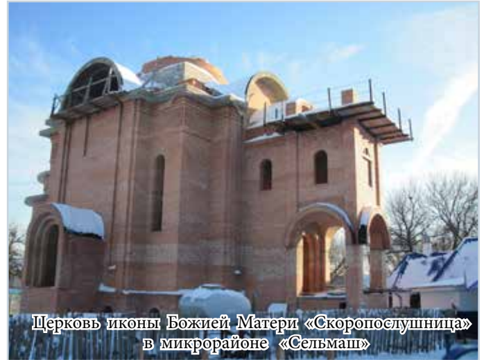
Церковь иконы Божией Матери «Скоропослушница» в микрорайоне «Сельмаш»

им и для кого? Какие проблемы возникают в этом важном деле, требующем неустанного настоятельного внимания и множество материальных средств? Позволю себе предложить вашему вниманию некоторые свои мысли на этот счет, в надежде на реакцию на мои размышления и ответы на поставленные вопросы.