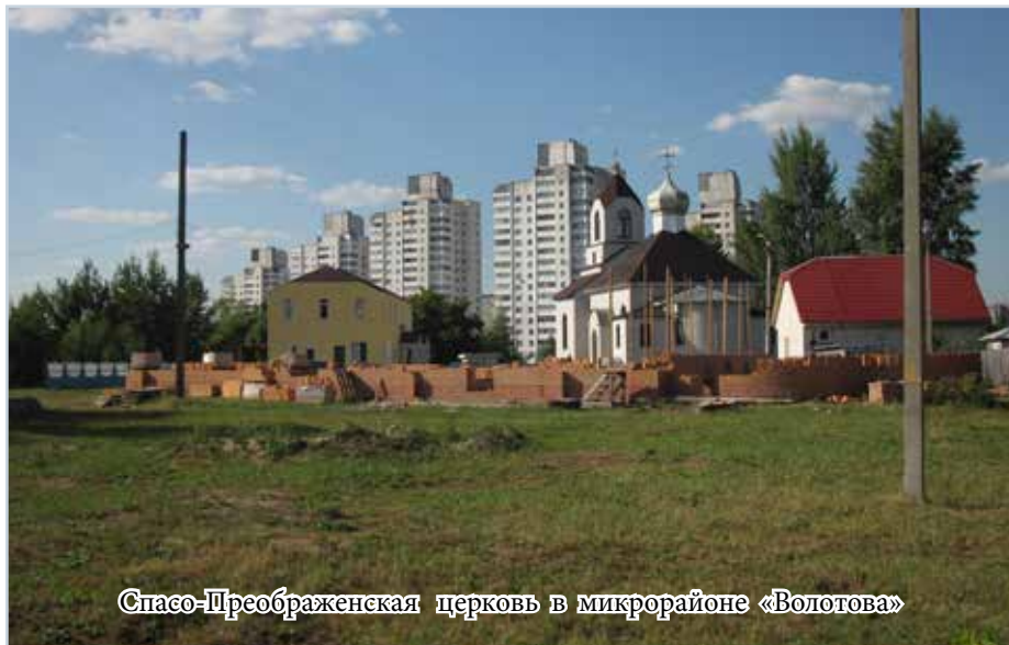
Спасо-Преображенская церковь в микрорайоне «Володова»

Таковы вопросы и проблемы, но каковы же ответы, каково решение. (Окончание на стр. 8)