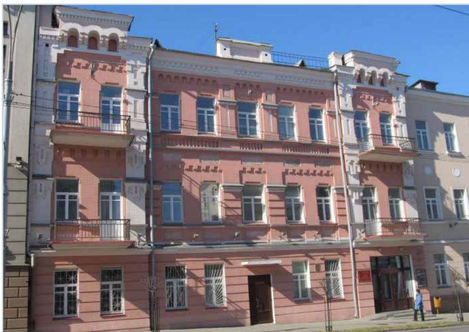
Гомельский государственный колледж искусств имени Н. Ф. Соколовского

130-летию со дня рождения Алексея Туренкова посвящается