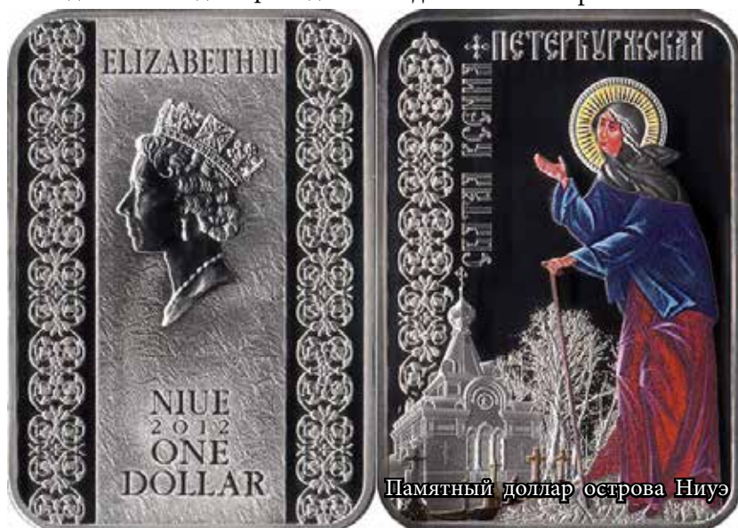
Памятный доллар острова Ниуэ

Первое прославление блаженной состоялось в 1978 году. Тогда Русская Зарубежная Церковь объявила о её канонизации. Десять лет спустя её примеру последовал и Поместный собор Русской Православной Церкви. С тех пор были построены десятки храмов и монастырей в память Ксении Петербургской, написано множество икон. Традиционно на иконах её изображают в красно-зелёной одежде в цвет военного мундира Андрея Фёдоровича, который она носила, а на заднем плане изображается церковь Смоленской иконы Божьей Матери, в строительстве которой блаженная участвовала. Самый, однако, экзотический пример сохранения памяти о героине нашей сегодняшней статьи относится к далёкому острову Ниуэ у побережья Новой Зеландии. Именно здесь в 2012 году была выпущена памятная серебряная монета номиналом в 1 новозеландский доллар. На лицевой её стороне изображена британская королева Елизавета II, а на обороте – наша знаменитая святая. Вот так дошла слава о Ксении Петербургской до жителей далёкого южного острова.