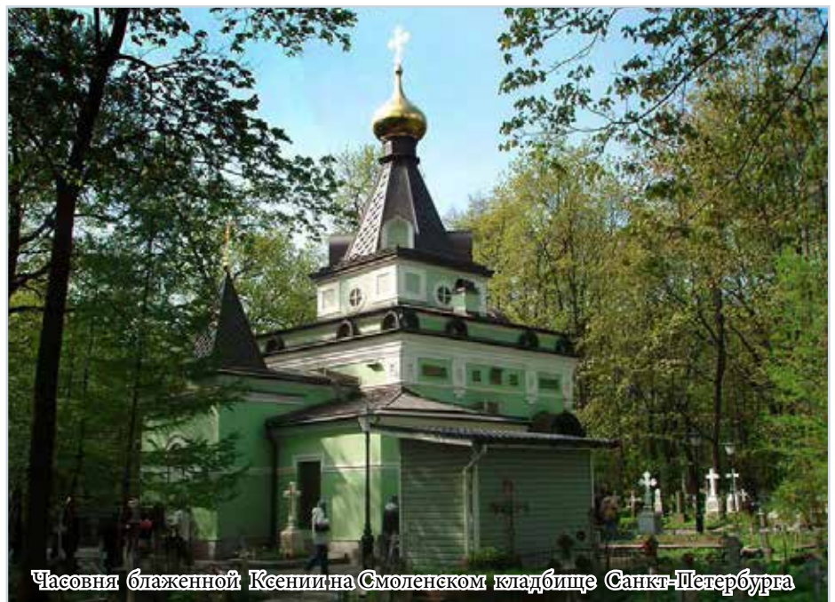
Часовня блаженной Ксении на Смоленском кладбище Санкт-Петербурга