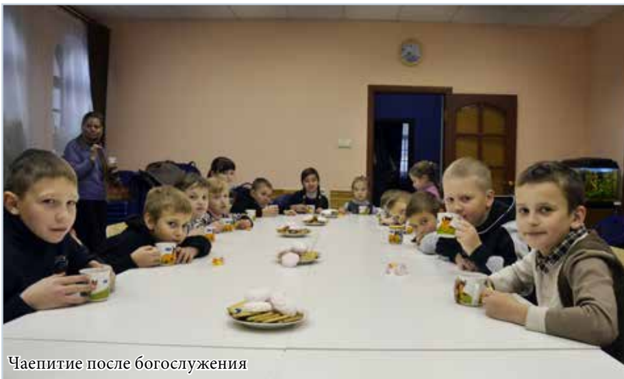
Чаепитие после богослужения