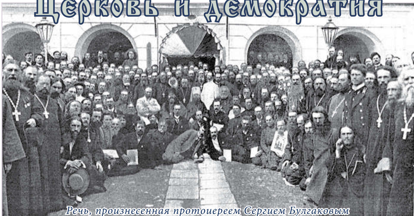
Речь, произнесенная протоиереем Сергеем Булгаковым на первом всероссийском съезде духовенства и мирян 2-го июня 1917 года в Москве

Выступая впервые на этом съезде, который призван посылить вывить разум и самосознание поместной русской церкви, я испытываю потребность говорить прежде всего не о частных ее нуждах, но о самоопределении церковном пред лицом современности. Одним из камней преткновения на этом пути является здесь могучий духовный соблазн, вызывающий двусмысленности, смешения и подмены и настоятельно требующий устранения, разъяснения и договоренности. Таким соблазном для церковного самосознания нашего времени, духовным его идолом, бесспорно, является «демократия». Итак, речь моя будет о церкви и демократии.