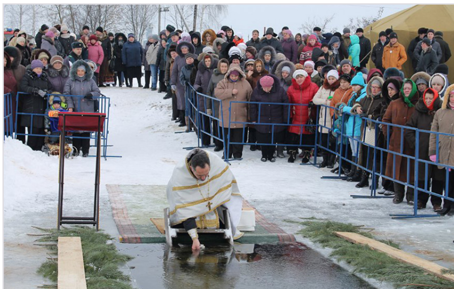
Освящение воды в озере Сырское Кормянского района

Вода – главный персонаж этого праздника, потому что именно эта стихия была первой, чего Христос коснулся как Бог. Церковные песнопения говорят о трепете воды, которая как бы возликовала от прикосновения