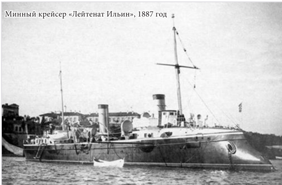
Минный крейсер «Лейтенант Ильин», 1887 год

было вызвано бурным развитием миноносцев, вооружённых исключительно минами. Возникла необходимость противодействия быстроходным наглецам. Самый простой и очевидный способ борьбы с миноносцами был изобретён такой: создавать миноносцы с артиллерийским вооружением, способные уничтожать миноносцы противника. При этом наличие артиллерии не отменяло применения эскадренных миноносцев (эсминцев) как собственно миноносцев, для борьбы с крупными боевыми кораблями. Часто в литературе эти корабли именуются истребителями, в Англии – «destroyers» (буквально, разрушителями). В русских дореволюционных морских справочниках иногда мож-