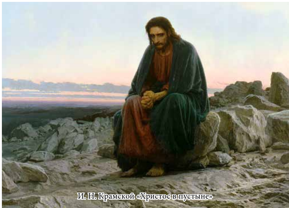
И. Н. Крамской «Христос в пустыне»