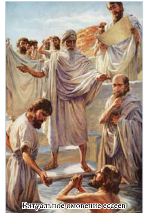
Ритуальное омовение ессеев

Марка говорит нам об Иоанне, аскете (Мк 1:6), который так же уходит в пустыню и совершает омовения 4 иудейского народа как знак покаяния (Мк 1:4). В отличие от кумранских ессеев, Иоанн не бежит от людей, но обращает к ним свою проповедь о том, что всем необходимо изменить свою жизнь, что является условием прощения грехов (Мк 1:5), ведь все стоит перед великим событием: по пути, приготовленному Иоанном, то есть к людям, оставившим прежний грешный образ жизни, идет Тот, кто несет новое Крещение – Святым Духом, то есть силой Бога. Иоанн же, подобно ветхозаветным пророкам, предвозвещает Его приход (Мк 1:7-8) 5 .