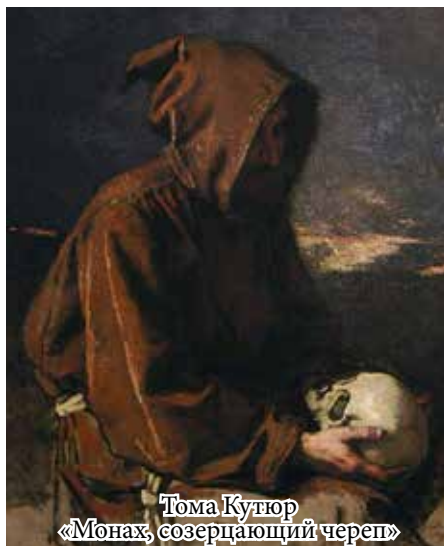
Тома Кунтор «Монах, созерцающий череп»

– Что же нам теперь – черепа друг другу дарить? Устанавливать на столах для размышлений?