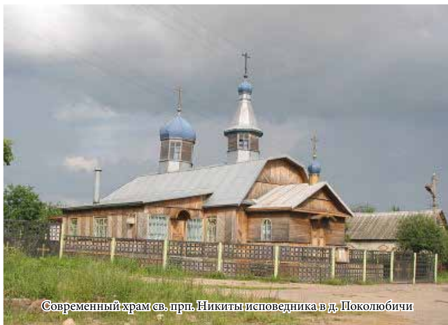
Современный храм св. прп. Никиты исповедника в д. Поколюбичи