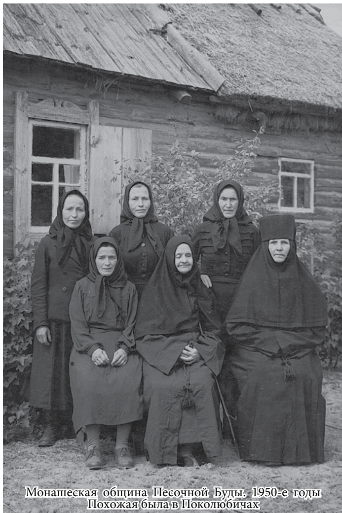
Монашеская община Песочной Буды, 1950-е годы. Похожая была в Поколюбичах

В 1937 году началась новая волна репрессий в отношении верующих и других вредных, по мнению Советской власти, эле-