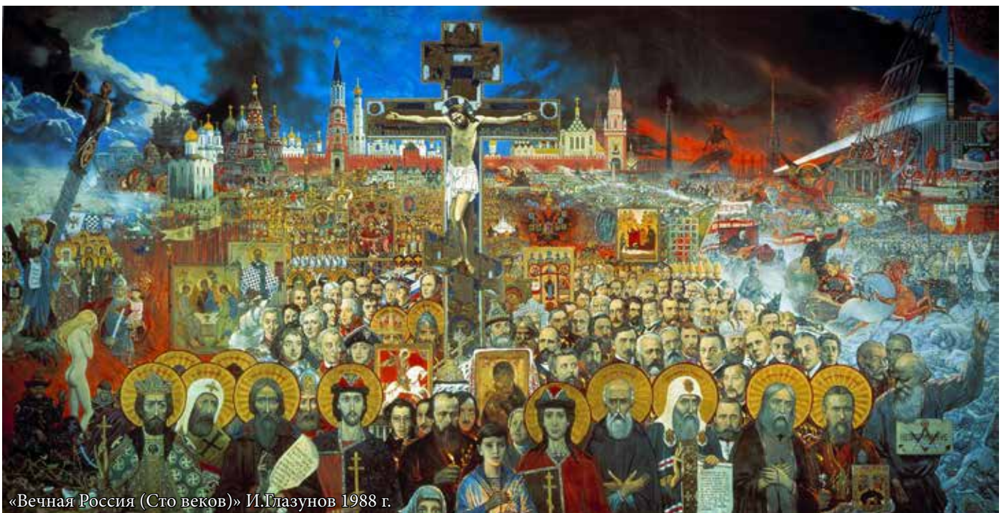
«Вечная Россия (Сто веков)» И. Глазунов 1988 г.

Из книги митрополита Сурожского АНТОНИА «Воскресные Евангельские чтения по Пятидесятнице. Часть III. (Проповеди)» 25 июня 1989 г.