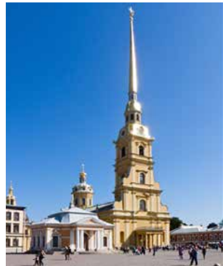
Петропавловский собор Санкт-Петербурга