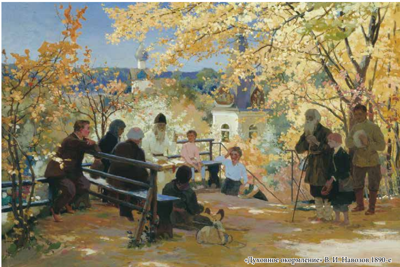
«Духовное окормление» В. И. Навозов 1890-е