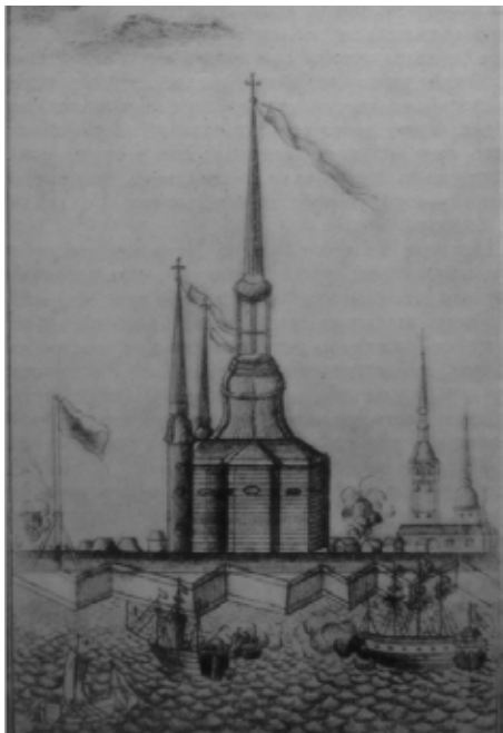
Деревянная церковь святых Петра и Павла. Гравюра начала XVIII века