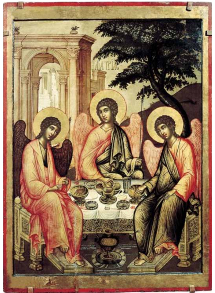
Святая Троица. С. Ушаков. 1671

«Ненавистная рознь мира сего» есть следствие болезни греха и самости, противопоставления себя другим, желания «быть, как боги». (Окончание на стр.4)