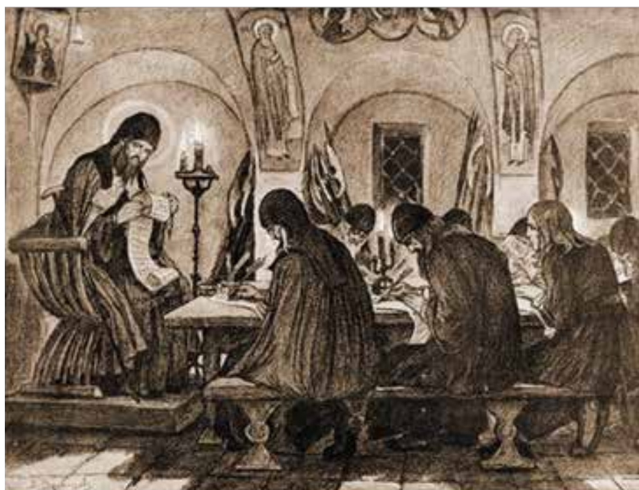
Архимандрит Дионисий диктует инокам патриотическую грамоту. Рисунок В. М. Васнецова, 1911 г.

Троице-Сергиева лавра времён Дионисия стала приютом для всех голодных, изувеченных, сирот, пострадавших от военного лихолетья смутного времени. Не было числа этим несчастным, наводнившим и саму обитель, и слободы, и сёла монастырские. В такой ситуации архимандрит принял решение: «Пусть каждый делает все, что может для других, а дом Святой