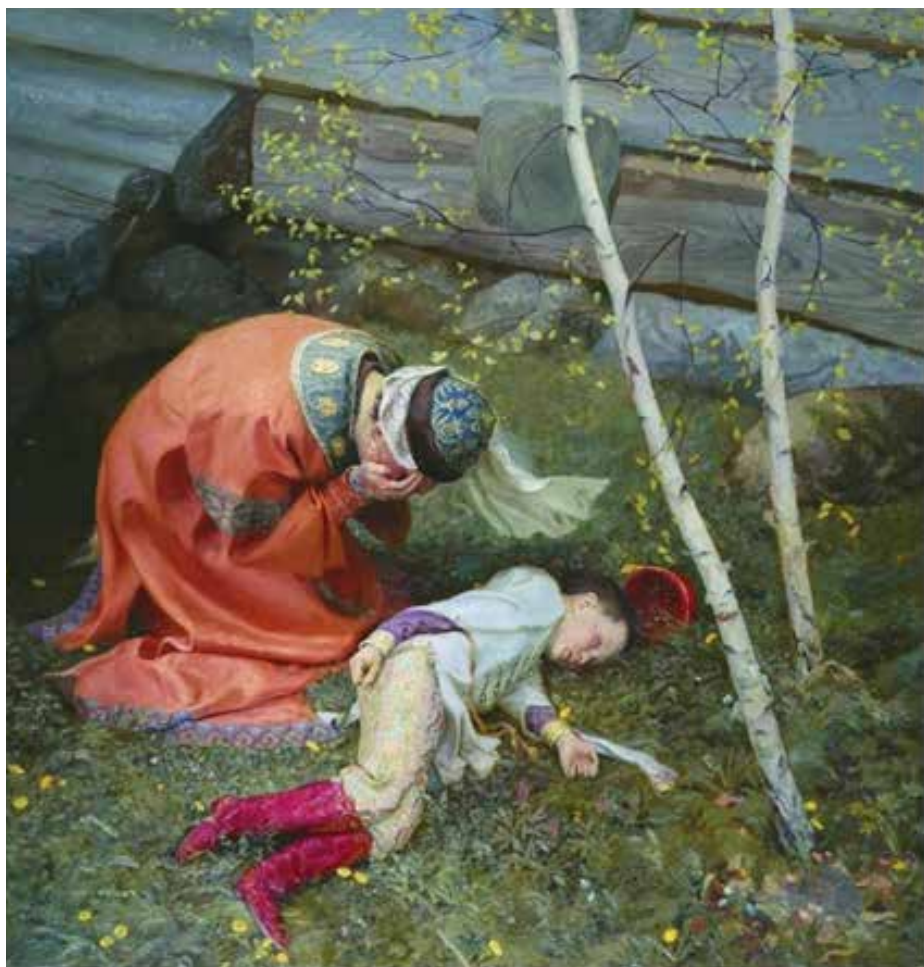
«Мария Нагая и Царевич Димитрий» Картина современного художника Сергея Блинкова

В начале июля 1606 года в Углич прибыл Митрополит Ростовский Филарет, будущий Патриарх. Он возглавил комиссию, направленную, по словам самого Василия Шуйского «уста лжущия заградить и очи неверующия ослепить глаголющим, яко живый избеже (царевич) от убийственных дланей». То есть, доказать, что Димитрий Иоаннович действительно