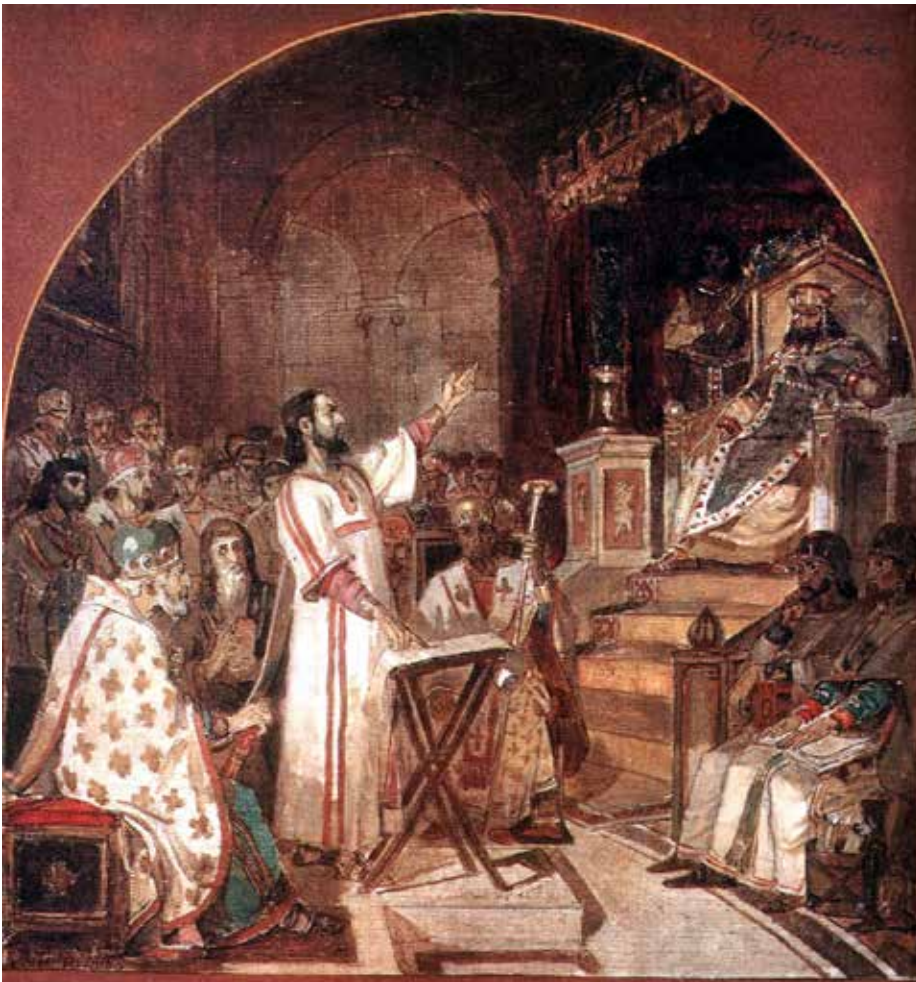
В.И.Суриков «Первый Вселенский Никейский Собор»

Из книги митрополита Сурожского АНТОНИА «Воскресные Евангельские чтения по Пятидесятнице. Часть III. (Проповеди)» 7 июня 1970 г.