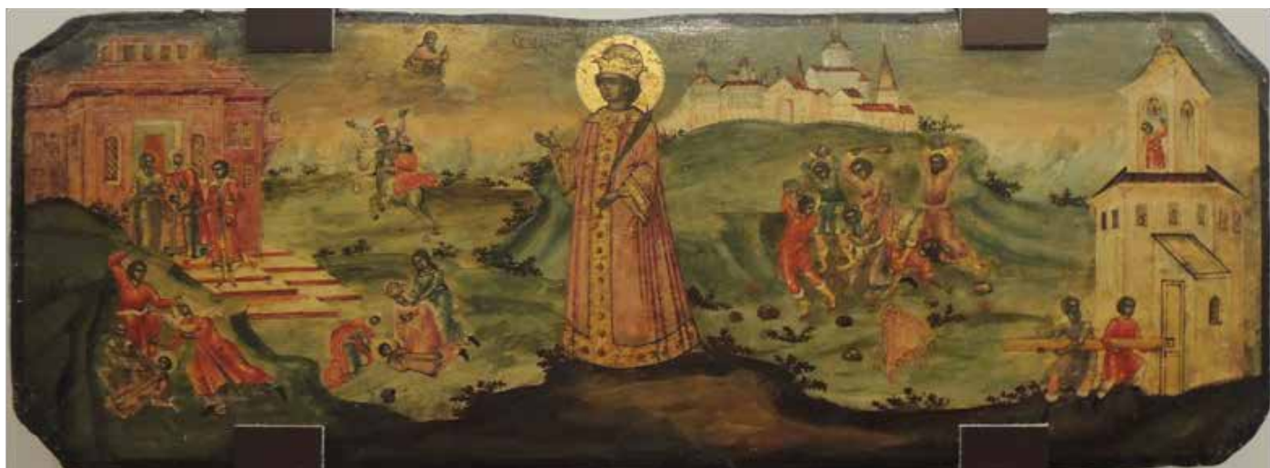
Святой благоверный Царевич Димитрий. Роспись XVII века последовательно изображает гибель его от рук убийц, народную расправу над ними и воздвижение храма на месте убийства

Внезапно с ним произошёл эпилептический припадок – «чёрная немощь», как выражались в то время. Мальчик упал прямо на «свайку», смертельно ранив себя в шею. Эту версию излагали очевидцы: кормилица Царевича и его дядя