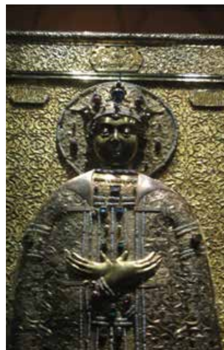
Крышка раки с мощами Царевича Димитрия

вания иноземцами и объединило народ под знаменем единой державы, а затем и единого Царя – Михаила Фёдоровича Романова.